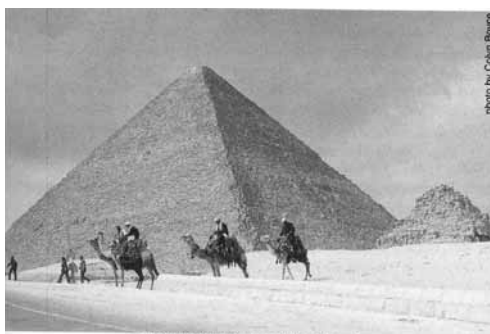
The Great Pyramids at Giza (Cairo), Egypt

In de nu algemeen gebruikelijke taal worden onder “werkzame vrijmetselaars” verstaan de steenleggers en handwerkslieden, die de orde vormden vóór de tijd van Sir Christopher Wren; en onder “bespiegelende vrijmetselaars” alle leden van de orde, zoals men die thans kent. De aan Jezus toegeschreven zin: “Gij zijt Petrus... op deze rots zal ik mijn gemeente bouwen, en de poorten der hel zullen dezelve niet overweldigen”, laat ... toch duidelijk zijn werkelijke betekenis zien. Wij hebben de betekenis medegedeeld van Pater en Petra bij de hiërofanten; de op de stenen tafels der laatste inwijding geschreven verklaring werd door de inwijder overhandigd aan